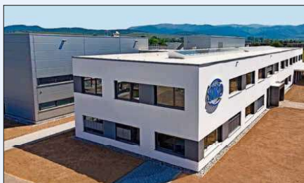
Neben der Fertigungsabteilung verfügt das neue Gebäude über Bereiche für Marketing und Vertrieb.

Siko-Geschäftsführer Sven Wischniewski fasst zusammen: „Das neue und moderne Werk in Bad Krozingen war ein notwendiger und richtiger Schritt für die Zukunft der Siko GmbH. Unsere jüngsten Produkte sind nicht nur innovativ, sondern auch wichtig bei der Realisierung von Industrie 4.0 Fertigungs- und Automatisierungsprozessen der Industrie. Bereiche also die stetig an Bedeutung gewinnen und wachsen. Der Standort Bad Krozingen gibt uns und unserer Belegschaft die Möglichkeit, mit den für uns relevanten Märkten mitzuwachsen und innovative Produkte zu fertigen und zu vermarkten, die zukünftige Marktimpulse setzen“. (RK)