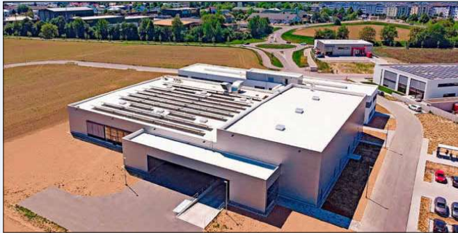
Das imposante Gebäude „Am Krozinger Weg“ bietet Platz für 70 Mitarbeiter und modernes Arbeiten.

Bad Krozingen. Die Schwarzwälder „SIKO GmbH“, bekannt als Hersteller für innovative Sensoren und Positioniersysteme, verwirklichte jüngst einen neuen Meilenstein ihrer über 50-jährigen Firmengeschichte. Realisiert wurde ein weiterer Standort in dem infrastrukturell starken Ort Bad Krozingen, circa 30 Kilometer entfernt des traditionellen Firmensitzes in Buchenbach.